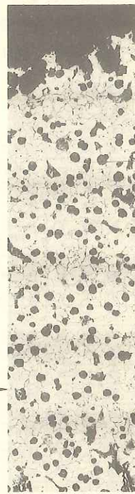
写真-3 黒鉛化部分を含む球状黒鉛鑄鉄管のミクロ組織