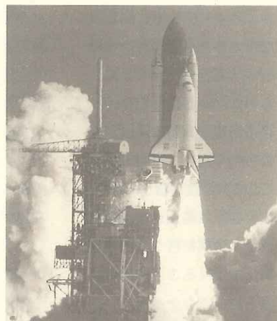
スペースシャトル——品質保証の集積

「品質保証」は、今年のキーワードです。この1年間に、品質保証という言葉がマスコミに登場した回数は、前年度の10倍を超えたそうです。また、PL法の登場等によって、「品質」あるいは「品質保証」という言葉の意味が変わり、具体的な損害賠償、その他の現実的な効果をもつものになりました。