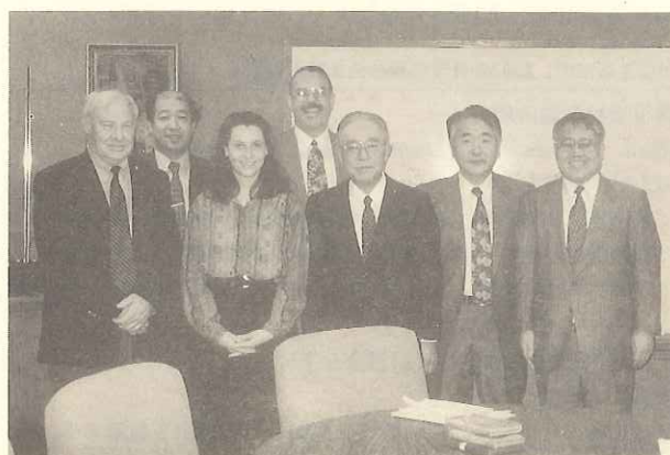
コマルコ社のアメリカ事務所(ケンタッキー州ルイビル)にて

最後に今回の機会を与えてくださった基盤技術研究促進センター殿に深く感謝いたします。