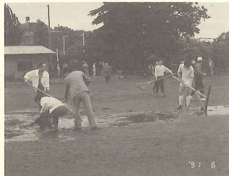
グラウンドに着いてみるとやはりあ

JRCM、ライムズ社、レオテック社及びアリシウム社の親睦会は、6月1日(土)にソフトボール大会を開催した。JRCM及びそのOBと各研究会社のメンバー総勢40名強の大会である。野外スポーツにはとかく雨に気を揉むが、今回も前日雨、当日の予報も雨というなかでの開催となった。