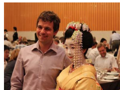
図8 舞妓さんと一緒に記念写真