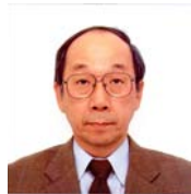
東北大学大学院工学研究科 教授 Creep 2012 組織委員長