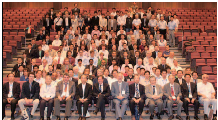
図2 基調講演後の会場での集合写真