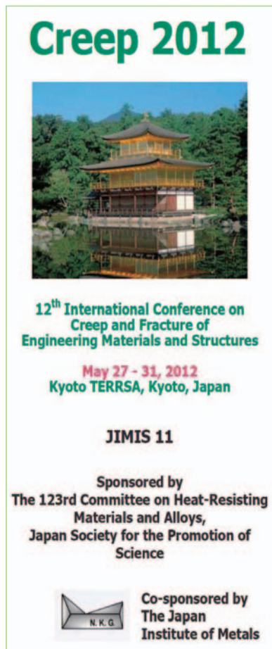
図1 クリープ国際会議案内表紙

1件、そして一般講演は、日本から50件、欧州から73件（ドイツ26、イギリス6、フランス11、チェコ8、ロシア6、イタリア4、スペイン2、その他10）、北米から6件（アメリカ5、カナダ1）、日本を除くアジアから21件（中国8、韓国3、インド6、その他4）、オーストラリア1件、であった。表1に会議プログラムの全体構成を示す。内容は、クリープ変形、クリープ・疲労、破壊、モデリング、寿命評価、試験法等、材料別では、鉄鋼、超合金、アルミニウム、マグネシウム、銅、セラミックス等の多岐にわたるも