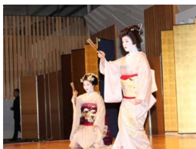
図7 バンケット会場での舞の舞台

(3)と同様にプロジェクト研究で実施した Ni 基合金の開発における、強化因子 (Mo 固溶強化、 \gamma' 析出強化、炭化物析出強化)とクリープ特性の関係についての金属組織学的研究成果の報告であり、粒内強化と粒界強化の制御の重要性を提案した。このような研究の重要性について支持する意見が寄せられた。