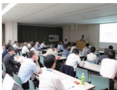
図5 セッション会場の講演状況

会議は4つのセッション会場に分かれており、高温クリープSG関係の講演全てを筆者一人で聴取することはできなかった。そのために、講演者がまと