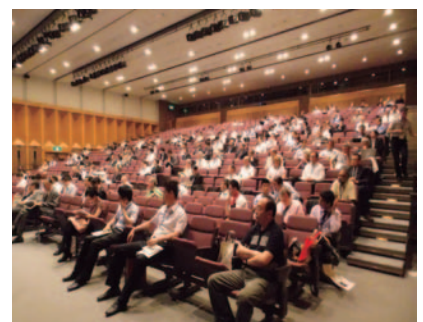
図4 基調講演を聴く参加者