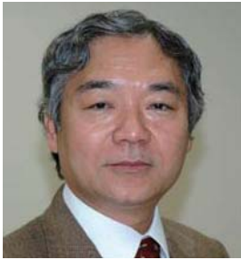
東京工業大学大学院 理工学研究科材料工学専攻